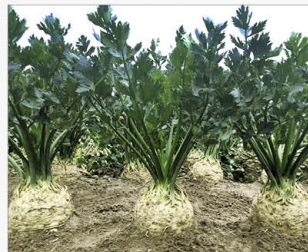
Codex F1 nou