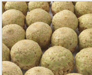
Princino F1 nou