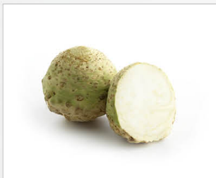
Markiz F1 nou